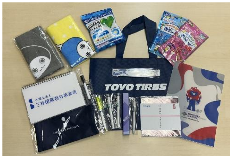
（写真は昨年の参加賞です。）